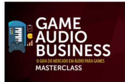
MASTERCLASS GAME AUDIO BUSINESS